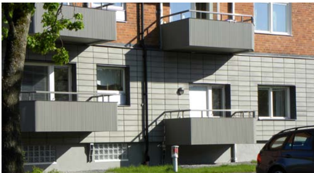
Sten med slät yta och färg anpassad till balkonger

Fasadmönster med olika format och färger kan enkelt utföras, med rutmönster eller förskjutna vertikala fogar.